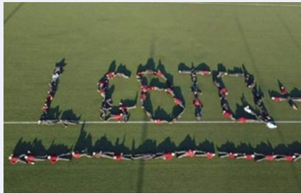
Daltaí ag litriú an acrainm LADTA+ ag Scoil na mBráithre Críostaí, Baile Átha Cliath.