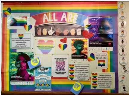
Clár fógraí LADTA+ le cód QR le haghaidh eolais agus línte cabhrach ag Mount St. Michael, Corcaigh.

Faigh inspioráid maidir le smaointe le haghaidh gníomhaíochtaí ó dhreamanna a ghlac páirt i Seachtain Feasachta Seas an Fód roimhe seo.