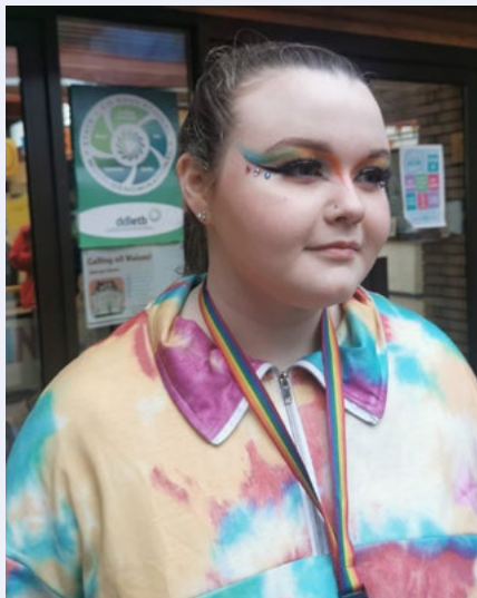
Lá smididh agus lá gan éide scoile le téama LADTA+ i gColáiste Pobail Ráth an Deagánaigh, Baile Átha Cliath.