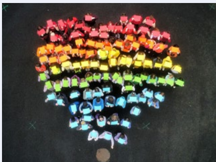
Lá na nGeansaithe Tuar Ceatha in Iar-bhunscoil Naomh Oilibhéir, An Mhí.