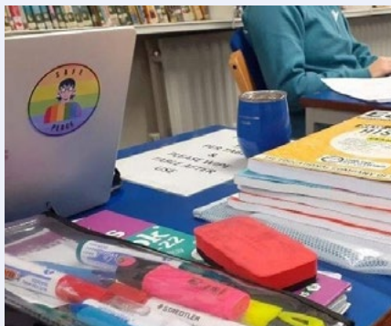
Greamáin tuar ceatha 'Safe place' do chomhghuaillithe na ndaltaí LADTA+ i gColáiste Choilm, Corcaigh.