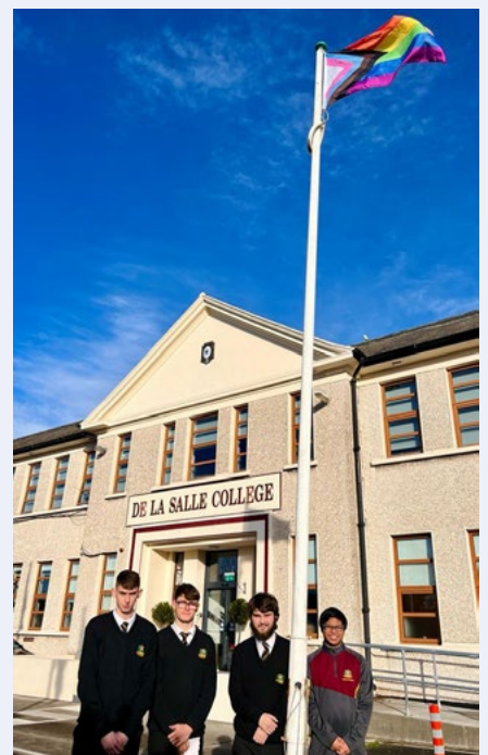
Daltaí ag ardú bhratach Bród i gColáiste De La Salle, Co. Lú.