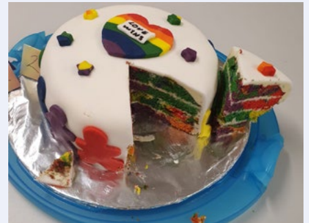
Díolachán cácaí tuar ceatha i gColáiste Pobail na Scairbhe, An Clár.